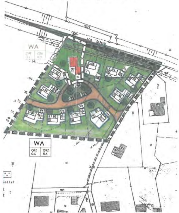
Bebauungsplanänderung M = 1/1000