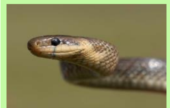
Gelbbauchunke (oben) und Äskulapnatter (unten)