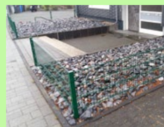
Versteinter Vorgarten.

Angesichts der biologischen Verarmung unserer Landschaft steigt die Kritik an geschotterten Vorgärten. Einige Länder oder Kommunen reagieren mit Verboten oder einer Begrünungspflicht – einen Überblick über die aktuelle Situation sowie weiterführende Informationen finden Sie hier .