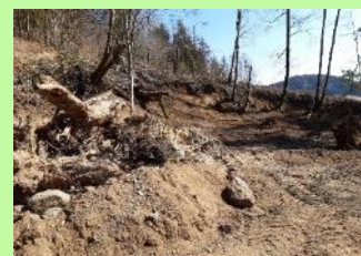
Erste Umsetzungsmaßnahmen