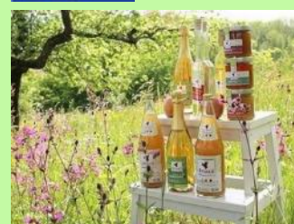
Förderung und Erhalt von Streuobstbeständen, Artenreichtum und der heimischen Obstkultur mit Vorwald-Produkten (Foto: K. Hartisch).