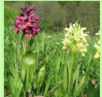
Zwei von über 200 Arten, für die die Höhere Naturschutzbehörde Erhaltungsmaßnahmen durchführt: oben Stauden-Lein (in Bayern vom Aussterben bedroht), unten Holunder-Knabenkraut (stark gefährdet).