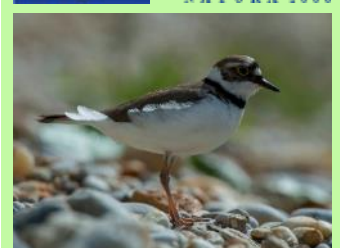
Flussregenpfeifer auf einer Kiesbank