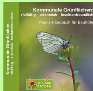
Titelbild des Praxis-Handbuchs für Bauhöfe