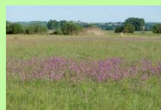
Blütenreiche Wiese im Königsauer Moos (oben) und Brachvogel

Weitere Informationen zum Moor- und Klimaschutz in Bayern finden Sie beim Bayerischen Landesamt für Umweltschutz und auf der Klimaschutzseite des StMUV.