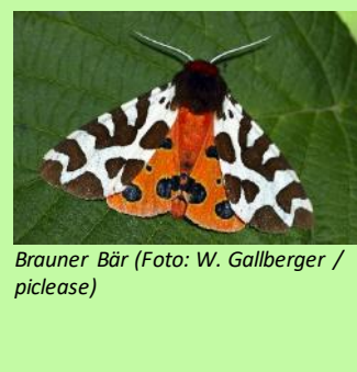
Brauner Bär