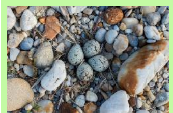
Die Eier sind zwischen den Steinen gut getarnt