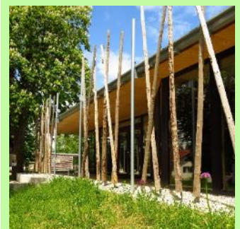
Hölzerne „Schilfstangen“ zieren das Naturium am Inn