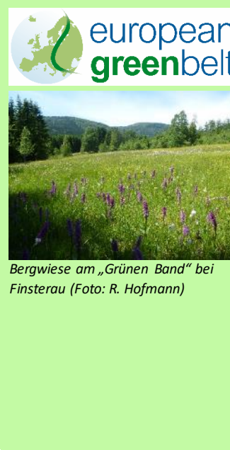
Bergwiese am „Grünen Band“ bei Finsterau

Der Fotowettbewerb findet im Rahmen des Projekts „ Quervernetzung Grünes Band “ des BUND statt (s. a. Beitrag weiter oben). Dieses hat zum Ziel, bundesweit in fünf Vernetzungsgebieten ökologische Achsen und Korridore – ausgehend vom Grünen Band – zu schaffen und langfristig zu erhalten.