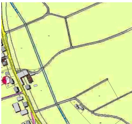
Abbildung 1: Ausschnitt aus dem rechtskräftigen Flächennutzungsplan der Marktgemeinde Ruhstorf a.d. Rott

Der Flächennutzungsplan stellt den geplanten Modulbereich als Fläche für die Landwirtschaft dar. Der Flächennutzungsplan wird im Parallelverfahren durch Deckblatt Nr. 26 geändert.