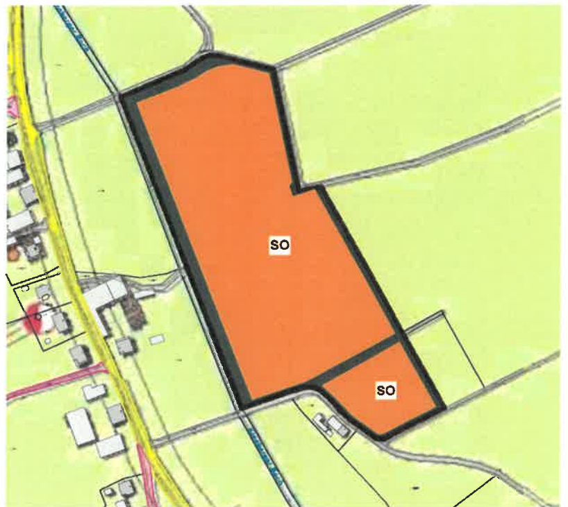
Flächennutzungsplan Deckblatt Nr. 28 - Bereich Solarpark