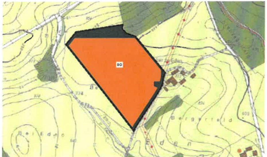
Flächennutzungsplan Deckblatt Nr. 25 - Bereich Solarpark