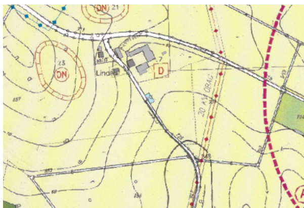
Abbildung 1: Ausschnitt aus dem rechtskräftigen Flächennutzungsplan der Marktgemeinde Ruhstorf a.d. Rott

Der Flächennutzungsplan stellt den geplanten Modulbereich als Fläche für die Landwirtschaft dar. Der Flächennutzungsplan wird durch Deckblatt Nr. 25 geändert.