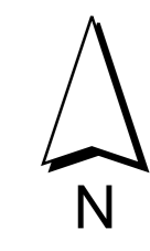
Übersicht M 1 : 100 000