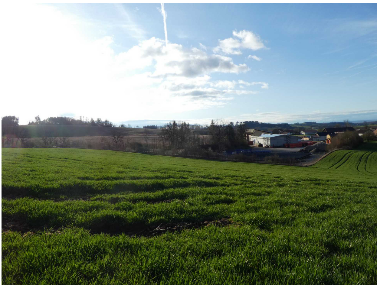
Abbildung 3: Blickrichtung Südosten vom Vorhabensbereich aus

Es ergeben sich Auswirkungen von mittlerer Erheblichkeit.