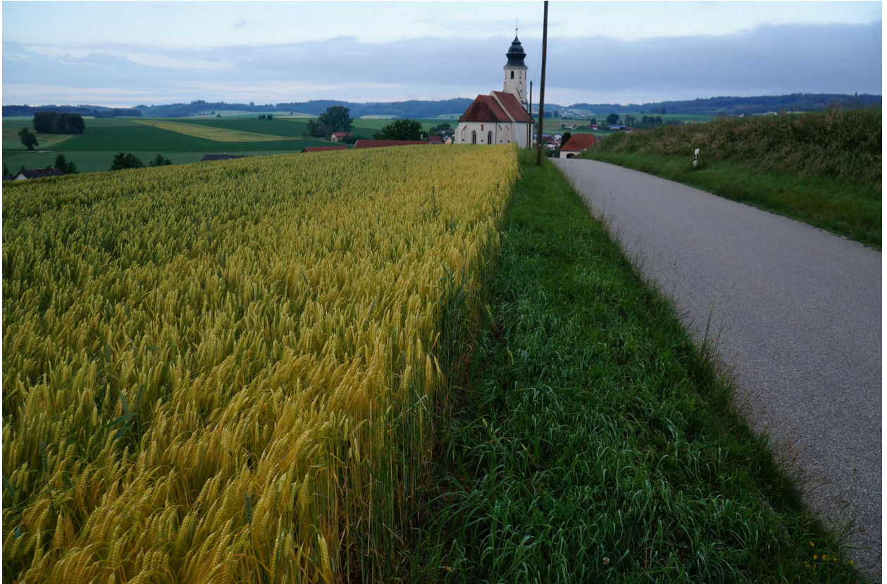
Abbildung 2: Blickbezug zur Kirche wird durch Verschiebung des Anlagenstandortes nach Süden erhalten

welche die Einsehbarkeit der Anlage aus Osten stark reduzieren. Im Süden schließt die Anlage an eine bestehende PV-Freiflächenanlage an. Der Standort kann daher als bereits vorbelastet betrachtet werden. Das Vorhabens befindet sich an einem Südhang bei 376 m über NN bis 361 m über NN. Wichtige Blickbezüge werden nicht berührt, nachdem im Zuge des Planungsprozesses die Ausdehnung der Anlage angepasst wurde.