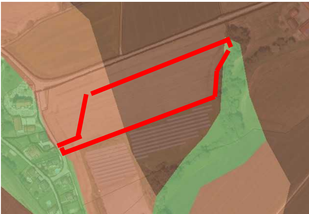
Abbildung 1: Bewertung des natürlichen Ertragsvermögens der Böden im Vorhabensbereich. Grün = keine Bewertung, hellbraun = hohes Ertragsvermögen, dunkelbraun = sehr hohes Ertragsvermögen. Rot umrahmt = Geltungsbereich Bebauungsplan

Gemäß Mitteilung des Landratsamts Passau (Sachgebiet Wasserrecht) sind laut AbuDIS im betroffenen Bereich keine Altlasten bekannt.